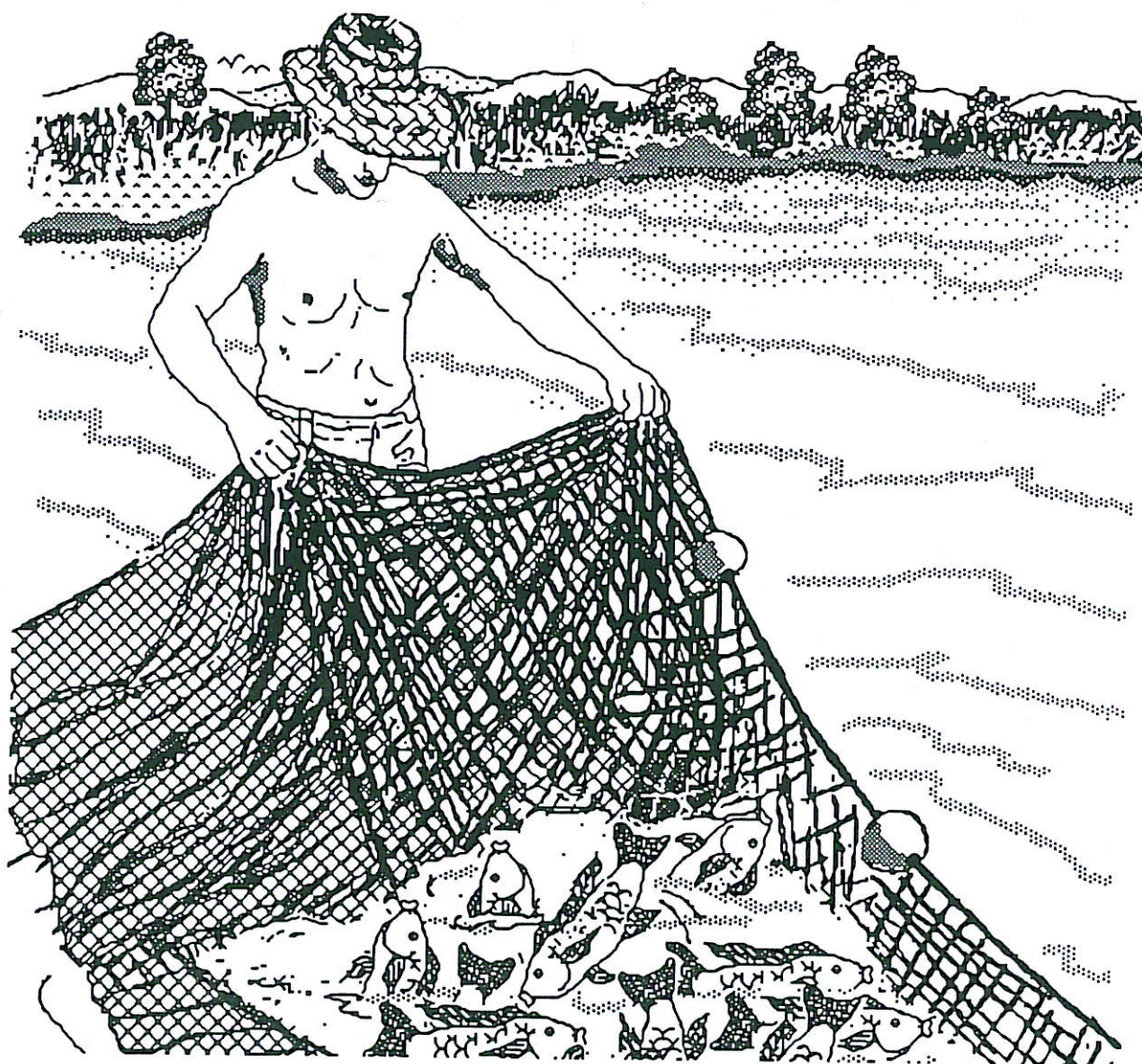
Fig. 1: Elevage en étangs

Les Tilapias sont originaires d'Afrique, mais ils ont été introduits dans de nombreux pays à travers le monde. Ils sont résistants aux maladies, se reproduisent facilement, consomment une nourriture variée et tolèrent une eau de qualité médiocre avec un faible taux d'oxygène dissous. La plupart se développeront dans une eau saumâtre, certains s'adapteront à l'eau de mer. Ces caractéristiques rendent les tilapias aptes à l'élevage dans la plupart des pays en voie de développement. Le plus souvent, ils sont élevés en étangs, en cages ou dans les rizières. On trouvera à la fin de ce manuel un guide abrégé donnant les caractéristiques des espèces les plus importantes de tilapia.