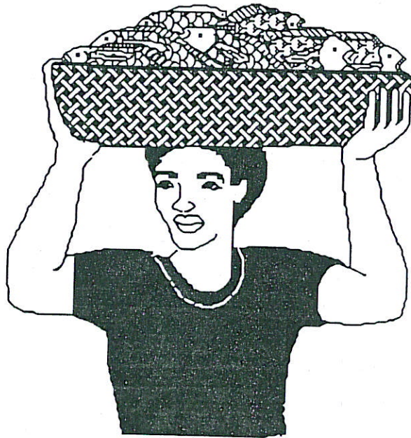
Figura 1: Los fertilizantes incrementan la producción de peces.

Un estanque es un ambiente especial creado por el hombre, el cual debe ser manejado apropiadamente para alcanzar una producción adecuada de peces. Por varios siglos, los piscicultores han incrementado la producción de peces en estanques utilizando fertilizantes inorgánicos o químicos y fertilizantes orgánicos o "estiércoles" (Figura 1).